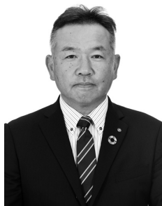
たき がみ さだ たか 龍 上 定 隆