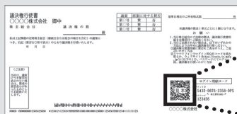
議決権行使書副票（右側）

お手持ちのスマートフォンにて、同封の議決権行使書副票（右側）に記載の「ログイン用QRコード」を読み取る。