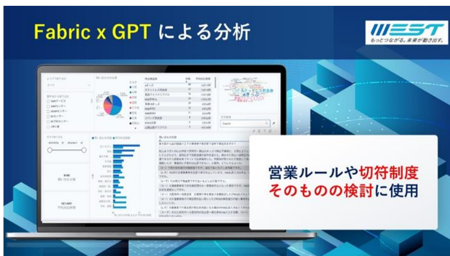
▲データ分析画面のイメージ（「Microsoft AI Day」のJR西日本セッション資料より）