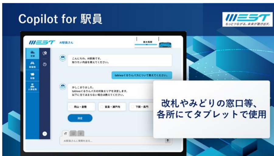
▲タブレット画面のイメージ（「Microsoft AI Day」のJR西日本セッション資料より）