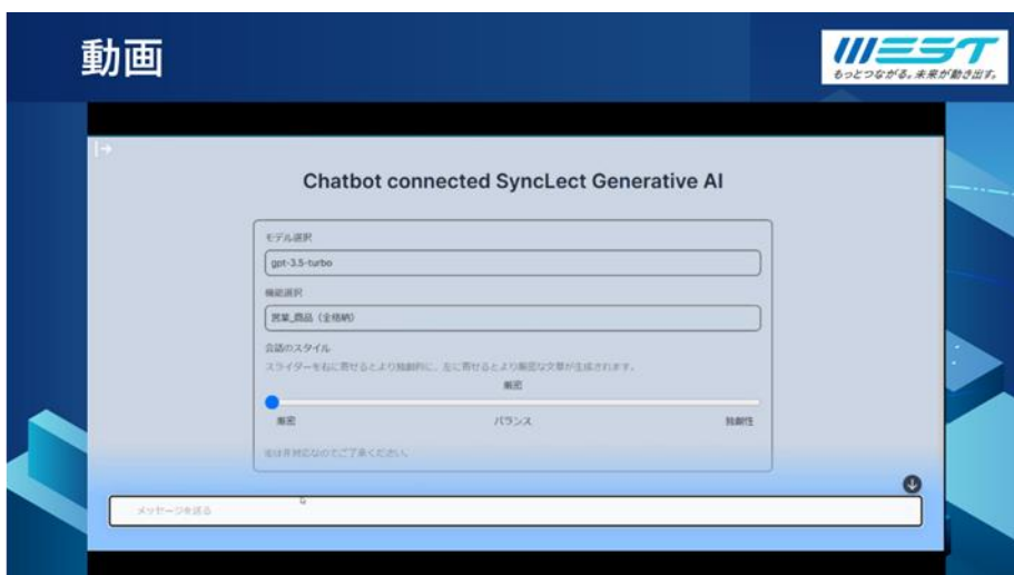
▲機能設定の画面イメージ