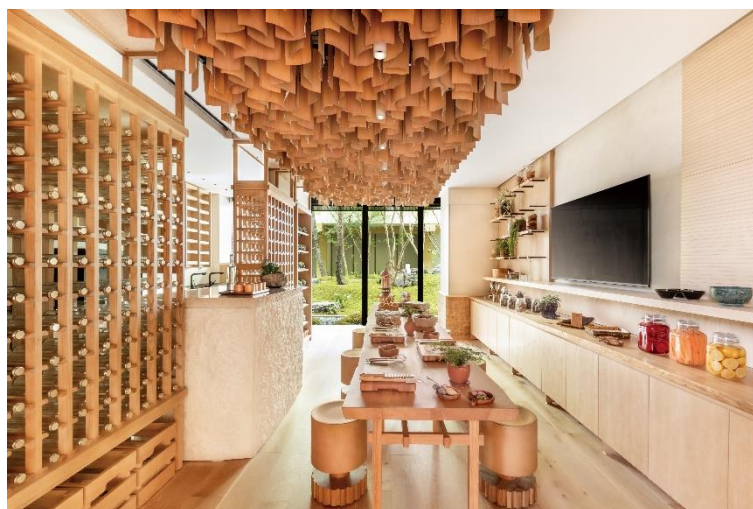
サステナビリティについて学べる「アースラボ」

サステナビリティ（持続可能性）は、シックスセンスにとって最も大切な価値観の一つです。開発段階における環境に配慮した設計・建設から運営、地域社会への貢献に至るまで、その姿勢は徹底されています。宿泊されるゲストは、サステナビリティ ツアーや、ホテル内の「アースラボ」（シックスセンスのサステナビリティに関する活動を紹介し、持続可能な取り組みを学ぶことができる拠点）と「アルケミーバー」（天然由来の材料を用いた手作り体験ワークショップなどを開催する施設）のワークショップにご参加いただけます。