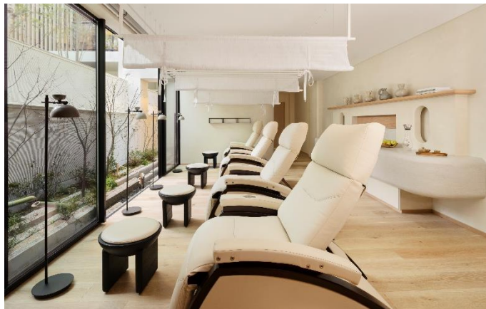
バイオハック リカバリー ラウンジ

また、シックスセンス スパ 京都限定のトリートメント「阿吽（あうん）」は、伝統的なお香を使ったリチュアルから始まる、身体の調和を図るマッサージを行います。音叉の振動で気の流れを促進し、心の平穏や調和、悟りを追求する禅の思想を象徴した、シグネチャーメニューの一つです。また、施設内に京都府内唯一の「WATSU(ワツ)/水中ボディワーク」専用プールを備え、心身の状態を整えるボディワークを提供します。そして「バイオハック リカバリー ラウンジ」（最先端機器を活用して疲労回復を図る専用エリア）は、到着時の時差ボケや旅ナカの疲れからの速やかな回復に最適です。