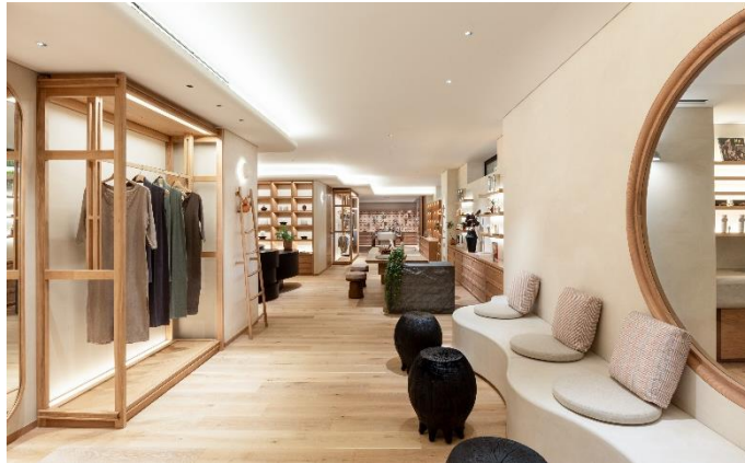
シックスセンスならではのアイテムを取りそろえたブティックを併設するスパ

「シックスセンス スパ 京都」は、京都の「禅」思想、伝統的なヒーリング手法、最先端の科学を融合し、あらゆる角度からゲストをサポートします。ウェルネスへの旅路は、約40種類のバイオマーカーを用いて、わずか数分でゲストの体の内側まで測定する「ウェルネススクリーニング」から。このスクリーニングの結果を踏まえながら、ウェルネスの専門家が個々のご要望や目標に合わせたアドバイスや提案を行います。