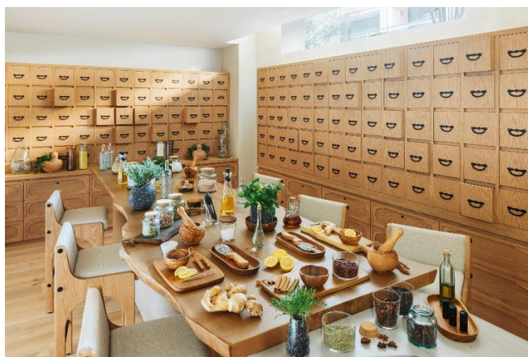
天然由来の材料を用いた手作り体験ワークショップなどを開催する「アルケミーバー」

サステナビリティ（持続可能性）は、シックスセンスにとって最も大切な価値観の一つです。開発段階における環境に配慮した設計・建設から運営、地域社会への貢献に至るまで、その姿勢は徹底されています。宿泊されるゲストは、サステナビリティ ツアーや、ホテル内の「アースラボ」（シックスセンスのサステナビリティに関する活動を紹介し、持続可能な取り組みを学ぶことができる拠点）と「アルケミーバー」（天然由来の材料を用いた手作り体験ワークショップなどを開催する施設）のワークショップにご参加いただけます。