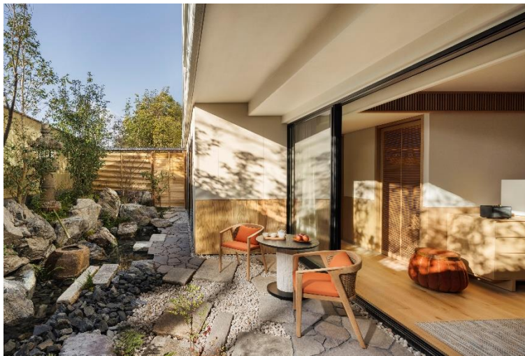
プライベートガーデンを備えた「プレミアスイートガーデン」

平安時代の“雅”を軸に自然とのつながりを重視したデザインは、12種類の客室タイプからお選びいただける8室のスイートを含む81室の客室にも反映されており、安らぎの空間が広がっています。その中でも、伝統的な日本庭園の中庭付き「プレミアスイートガーデン」から、238㎡の広さを備えた「3ベッドルーム ペントハウススイート」までのスペシャリティ・スイートでは、家族や友人との充実した時間が過ごせるよう、より広々としたスペースをご用意しています。