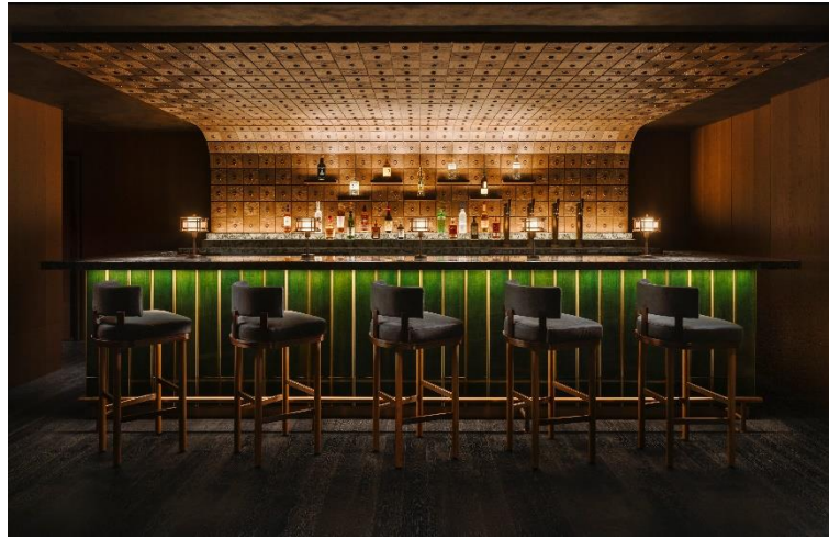
カクテルバー Nine Tails (ナインテイルズ)

「カクテルバー Nine Tails (ナインテイルズ)」は、アンティークな薬局をイメージしたデザインで、夜な夜なキツネたちがお気に入りの酒を楽しむ秘密の場所がコンセプト。オリジナルのサステナブルなカクテルと、職人の技が光る魅惑の香辛料や自家製シロップを使用したノンアルコールメニューをお楽しみいただける隠れ家バーです。