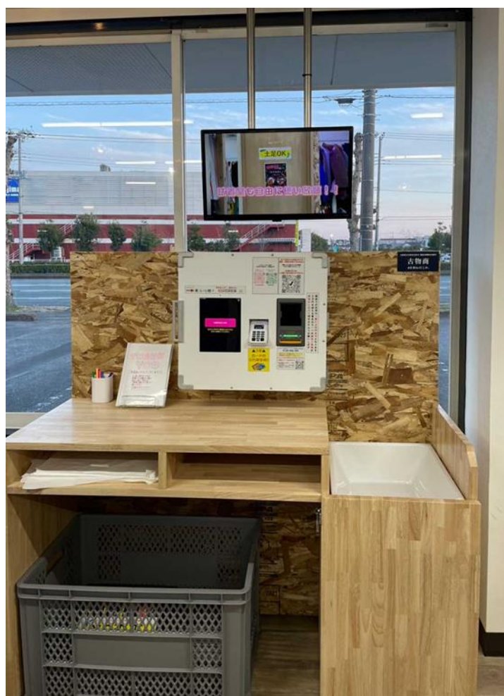
〈株式会社 RESTA 様「#古着 de 行こか。」店での「RFID Reading Tub」ご利用の様子〉

当社は、このたび、当社が提供する電波の漏れを防ぐ特殊筐体に RFID アンテナを内蔵した「RFID Reading Tub」を株式会社 RESTA 様(本社:大阪市、以下「RESTA」)が運営する無人アパレルショップ「#古着 de 行こか。」に導入されたことをお知らせいたします。