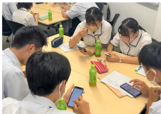
↑ 2023 年に実施したワークショップの様子