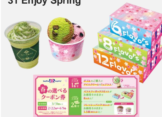
31 Enjoy Spring