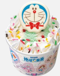
ハッピーフレンズドラえもん

©Fujiko-Pro, Shogakukan, TV-Asahi, Shin-ei, and ADK 2024