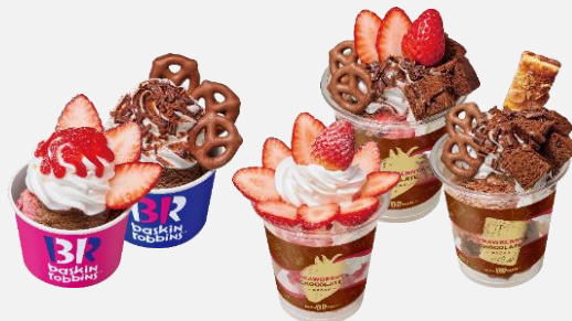
Chocolate & Strawberry Break