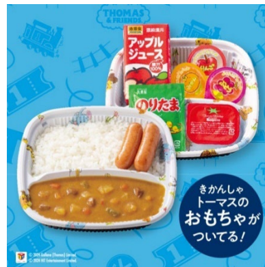
トーマス B セット(ミニカレー)