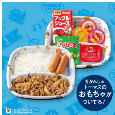
トーマス A セット(ミニ牛丼)