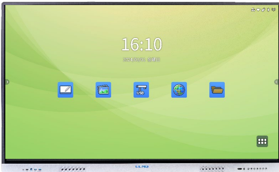
電子黒板/デジタルホワイトボード ハイグレードモデル*

2024年度ラインナップより、学校・教育機関向け xSync Board(バイシンクボード)および企業向け ELMO Board を ELMO Board にブランドを統一することとなりました。