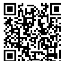
電子黒板／デジタルホワイトボード ハイグレードモデル PR 動画