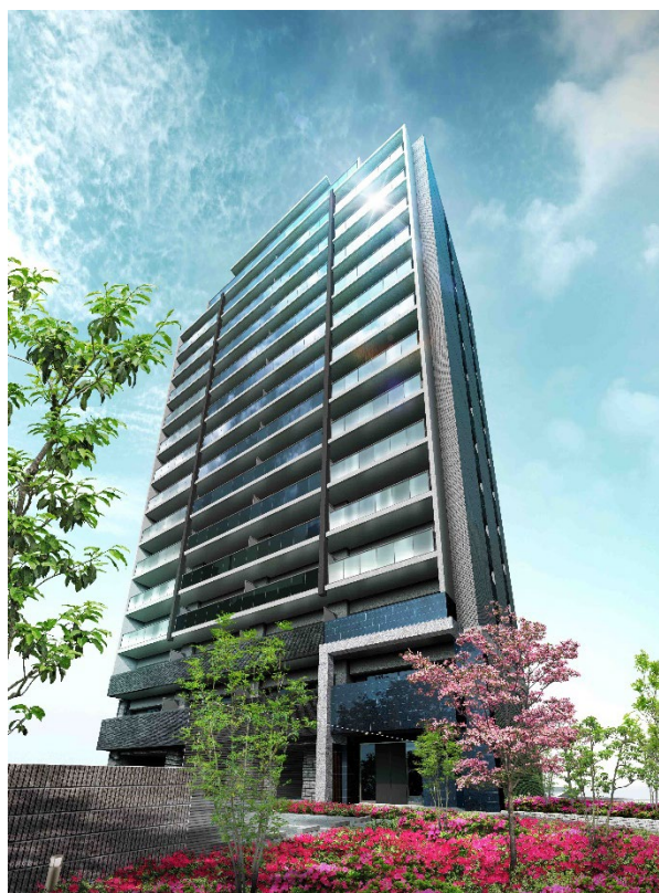
< 外観 >