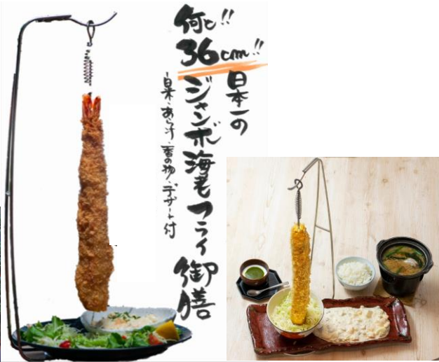
タルタルの沼 ロング牡蠣フライ御膳