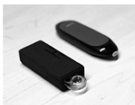
3チャンネルポケットサイズ (左) (75 mm x 30 mm x 15 mm) *右は入基の取組のための電子タグ

PCR 検査と同等以上の高い検出感度・特異性かつ、約6分で迅速に 性感染症を始めとした様々な感染症の原因となるウイルスや細菌を検出可能