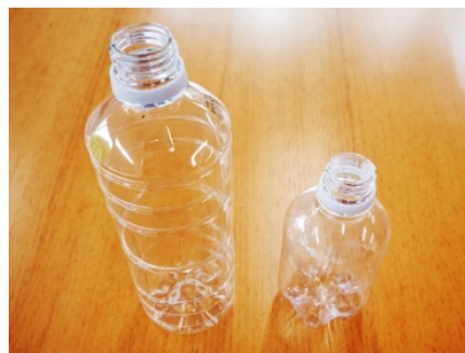
リサイクル製品(ボトルtoボトル)