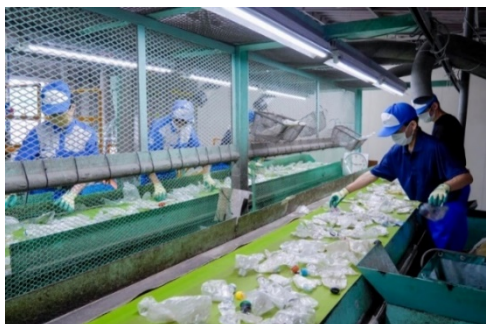
ペットボトル選別の様子

株タッグは、1999年に創業して以来、北海道・東北6県を中心に、容器包装リサイクル法に則ったプラスチック廃材の再商品化事業に取り組んでおります。また、東北地方で最大級のペットボトルリサイクル設備を保有しており、プラスチック廃材を再生原料化するだけでなく、新規性のある再生製品の開発・製造・販売を通して、資源循環社会の構築やリサイクル産業の創出に寄与することを目指しています。