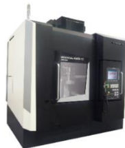
Vertical Mate 85