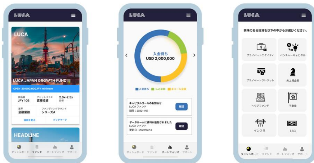
スマートフォン利用時のイメージ画像

オルタナティブ投資の複雑な投資プロセスをワンストップで完結できるプラットフォームを通して、透明性の高い情報を適切に投資家に供給すると共に、投資工程をデジタルで効率化し、モニタリング活動までを一貫して行う仕組みで、適切な手数料率での商品の選定・供給を行う予定です。