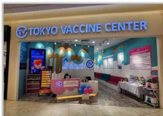
ベトナム ハノイにて運営をサポートしているクリニック

本提携は、両社の強みを活かし、東南アジア圏の医療課題である医療レベルの引き上げに寄与することを目的として