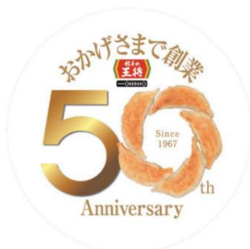
創業50周年ロゴマーク

全国の「餃子の王将(一部店舗を除く)」、 「GYOZA OHSHO 大宮駅西口店」 「GYOZA OHSHO プライムツリー赤池店」