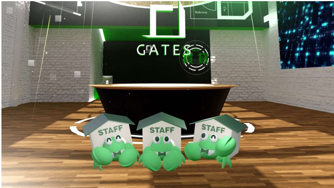
GATES 株式会社メタバース支店 完成図