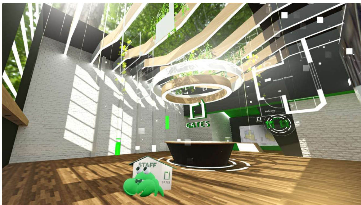
GATES 株式会社メタバース支店 完成図