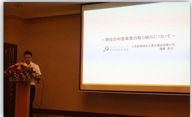
セミナーで講演を行いました