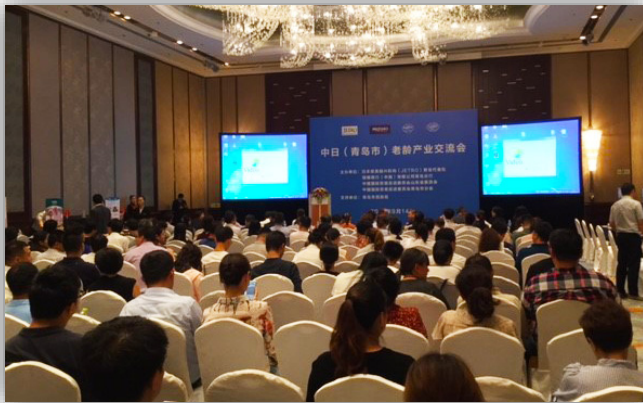
日中高齢者産業交流会の様子

この交流会は、JETROが日本の高齢者産業関連ビジネスの中国展開を促進するために、2013年より実施しているもので、商談会に加え、視察やセミナーなどが行われています。9月13日(水)には、山東新華錦長生養老運営有限公司が運営する青島市にある有料老人ホーム「長樂居」を交流会参加者など23名が視察をされました。また、14日(木)に開催されたセミナーでは、当社の駐在職員が中国での事業展開や「長樂居」の運営状況などについて講演を行い、ロングライフグループの中国における取り組みを多くの方に知っていただく良い機会となりました。