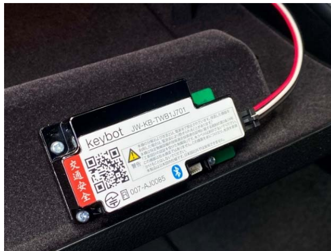
バーチャルキー車載器

「バーチャルキー」は、これまでの実績としてスマートバリュー「Patto」を使ったスズキディーラーの試乗車などのカーシェア化や、NTT 東日本の社用車を休日にカーシェア化する株式会社 NTT ル・パルク「ノッテッテ」、マンション住民に向けた EV カーシェアを提供する九州電力株式会社「weev」、福井県が取り組む「嶺南スマートエネルギーエリアプロジェクト」のカーシェアにも使われています。他にも「バーチャルキー」は、レンタカーの 24 時間非対面貸出しを実現したバリューートープ株式会社「オールタイムレンタカー」や中古車販売におけるローンの可能性を広げる株式会社 IDOM「ガリバースマートローン」、Jリーグ湘南ベルマーレホームタウン住民の方を中心に提供する「ベルマーレカーシェア」、奈良先端科学技術大学院大学におけるブロックチェーンを活用したカーシェアリング実験システム「持続可能モビリティ社会システム運用実験」でもご利用いただいております。