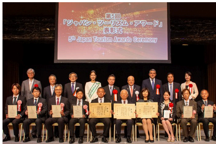
農泊と世界をつなぐ地域活性化サービス が 第5回ジャパン・ツーリズム・アワード「国土交通大臣賞」を受賞

ルベルゴ・ディフーズ・インターナショナル極東支部の代表理事や、住宅宿泊協会の共同代表理事を務めており、日本国内における「農泊」の第一人者として、広く・深い知見を有しています。