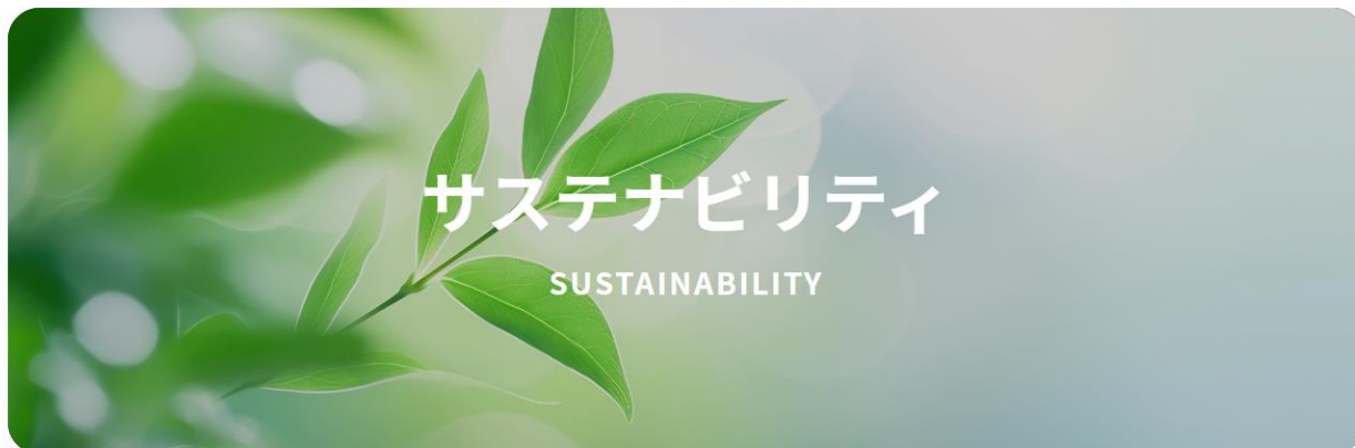
「サステナビリティ」サイト TOP 画面