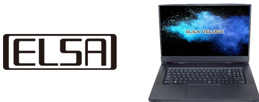
ELSA VELUGA G5-NM 1750AM ローカル AI モデル

エルザジャパンの『ELSA VELUGA G5-NM 1750AM ローカル AI モデル』は、NVIDIA RTX 5000 Ada 世代の GPU を搭載し、高度な AI 処理を実現するモバイルワークステーションです。「ailia DX Insight」のプリインストールにより、ユーザーは PC を起動してすぐにローカル AI 環境での業務を開始することができます。これにより、製造業や医療機関など、インターネットに接続せずにセキュアな環境で AI を活用できるユースケースが広がります。