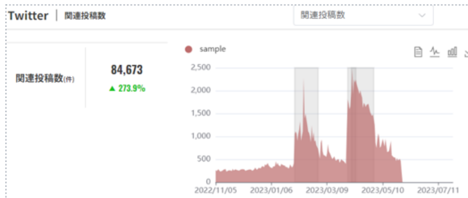
施策による SNS への波及効果

当社は、ClaN との業務連携を通じ、VTuber マーケティング支援に注力し、クライアントの利益最大化に向けた取り組みを実施してまいります。