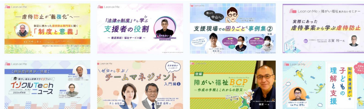
株式会社Lean on Meが提供する「Special Learning」 コンテンツ一例